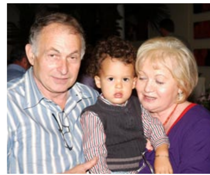
Nonni felici con il loro nipotino

Anche Clarence Seedorf con la sua fondazione "Champions for Children" è stato importante per la nascita di questo libro, ecco un suo pensiero: "Ho avuto la fortuna di crescere in ampi spazi verdi e vicino a persone anziane e come ben sapete gli anziani sono i nonni di tutti." Questa favola è piaciuta molto ed è diventata così uno strumento che sta aiutando molti Nonni e bambini attraverso la fondazione "Don Gnocchi" e la fondazione "Champions for Children".